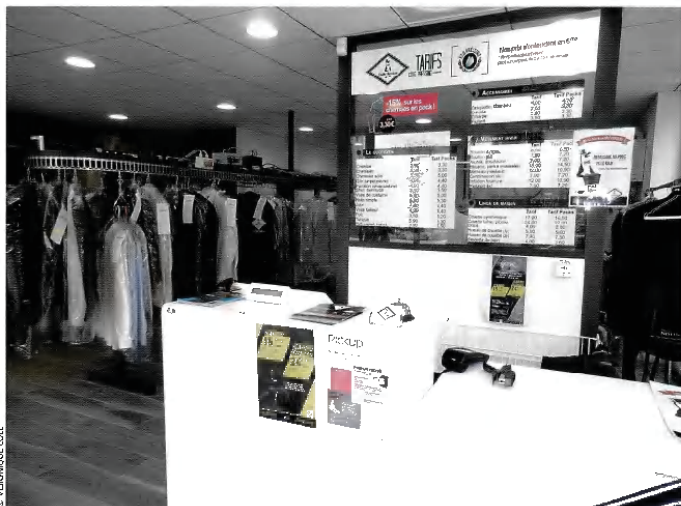
Quiki Services, éco-pressing et conciergerie (relais colis) développé par la Holding Tissot. À partir de juin, ce service sera ouvert aux entreprises en dehors de l'@7 Center.